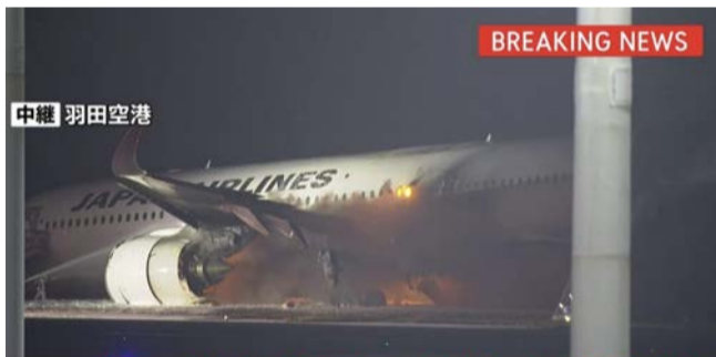
速報 羽田空港の滑走路で日本航空の機体が炎上中

とても容認できるものではありません。さらに声をあげ、すべての通勤快速・快速を復活させましょう。