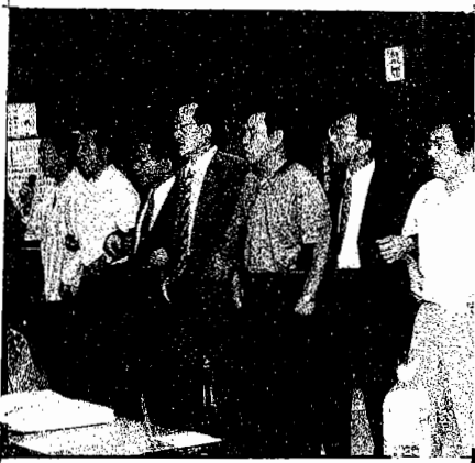
大失業と戦争の時代に通用する新しい世代の動労千葉を創り出す