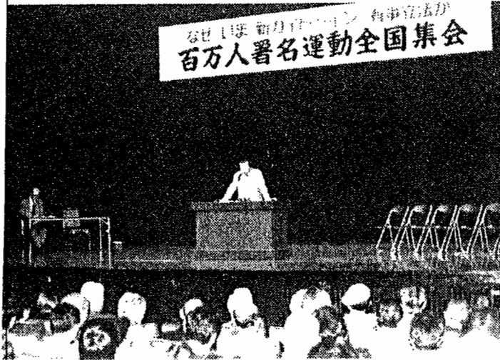
百万人署名運動全国集会