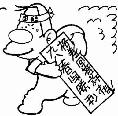
労働スクエア東京まで

最後に組合側より―外注化の問題、要員の問題、年令構成の問題は全く出ていない。再度申し入れを出して交渉したい。