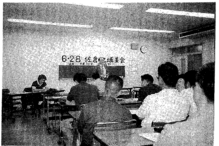
6-28 佐倉地域集会 基調報告を行う動労千葉布施副委員長。佐倉支部OBも参加する中、国鉄闘争-清算事業団闘争の重要性が確認された。(佐倉市中央公民館において)