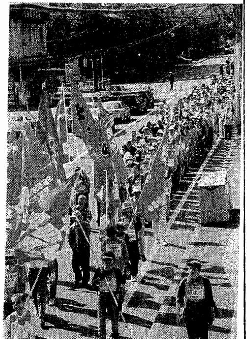
(5.22三里塚集会) 4500人の市内アモ