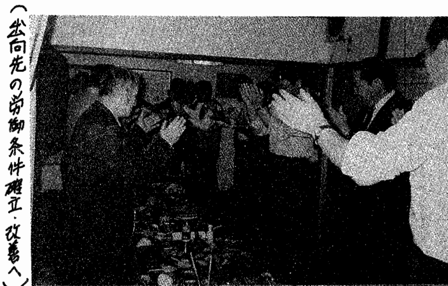
(出向先の労働条件確立・改善へ)

今後の出向先での労働条件確立・改善、 そして動労千葉の運動の拡大にとって、 出向者協議会の持つ意味は極めて大きい。 当日は、参加者全員から出向先での待 遇改善等の意見を聞き、動労千葉として 出向先企業に対する団体交渉の追求等が 確認されるなど、早期結成へ向け盛會裡 に終了した。