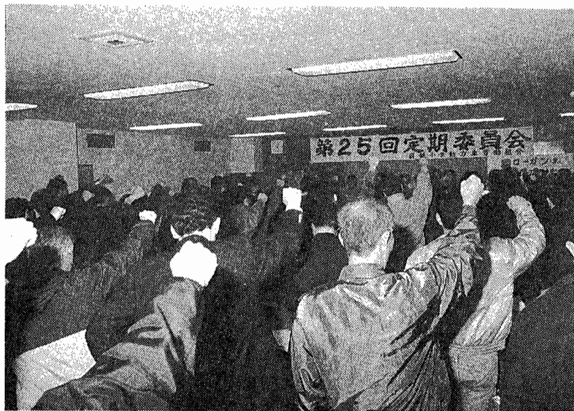
「ダイ改」斗争を総括し、中江選挙へ総決起を確認!