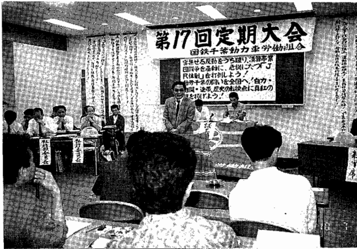
全組合員の総決起を熱烈に訴える中野委員長↑ 壇上に勢揃いし決意を表明する争議団の各氏→ ストライキでの自信を胸に次々と発言する代議員↓