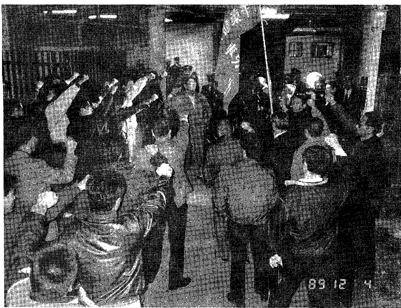
前夜総決起集会かちとる【千葉運転区前】

スト破りをはね返し、4名が 動労千葉に結集、ストに参加! JR東本社を先頭にしたスト圧殺 策動を粉碎し、闘いを貫徹!