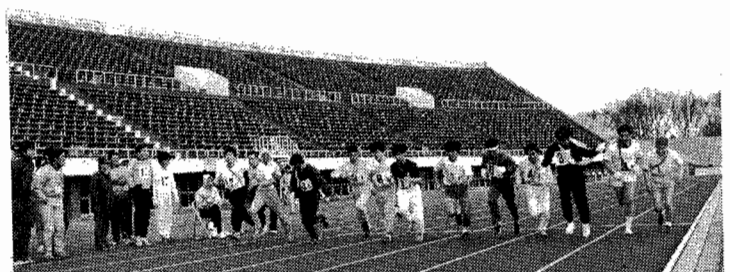
寒風を突いて一斉にスタート

十時三〇分にスタートした競技は、序盤、一区で千葉運転区がトップに立ちリードしたが、二区は佐倉、三区では新小岩Aがトップを奪い合うなど激しいデッドヒート