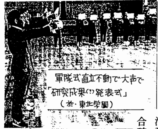
軍隊式直立不動で大声で「研究成果」の発表式 (於・東北学園)

ひまがなれば、体育館に集まって、軍隊分列行進のくり返し。号令するごと、号令のすまに、右、左へと動くこと、が「企業人」の神髄。全組合員の強固な団結で組織破壊攻撃を粉碎せよ！