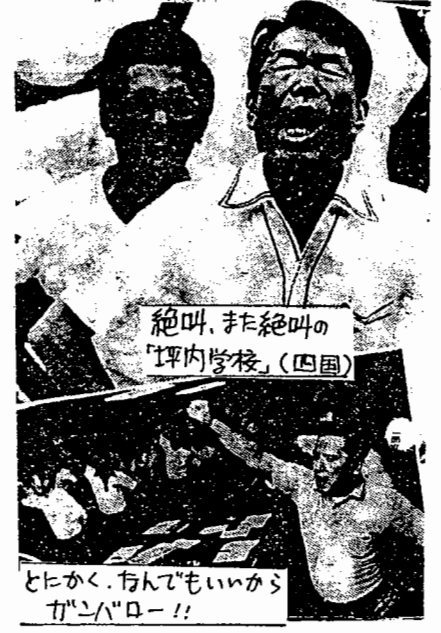
絶叫、また絶叫の『坪内学校』(四国)