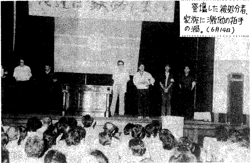
登壇した被処分者、家族に激励の拍手の場。(6月14日)

6・14上映会のために、動労千葉と県下の労働者は二五〇の労働組合を訪問し、三千枚のチケットを配り、九五〇枚分のカンパを集め、四万枚以上のビラをまきました。