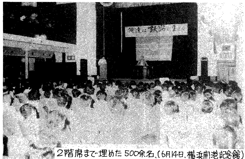
2階席まで埋めた500余名。(6月14日、横浜開港記念館)

当日、会場で寄せられたアンケートの中にも、「ビラを見てはじめて参加した」という人も多く見られ「今まで新聞報道だけでしか知らなかったが、この映画を見て自分の考えがすっかり変わりました。」