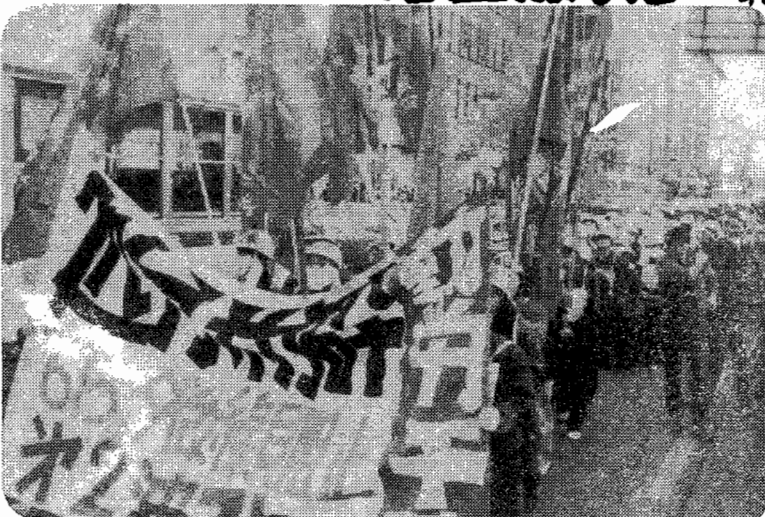
2-2総決起集会のち、千鉄管理局へ怒りのデモ