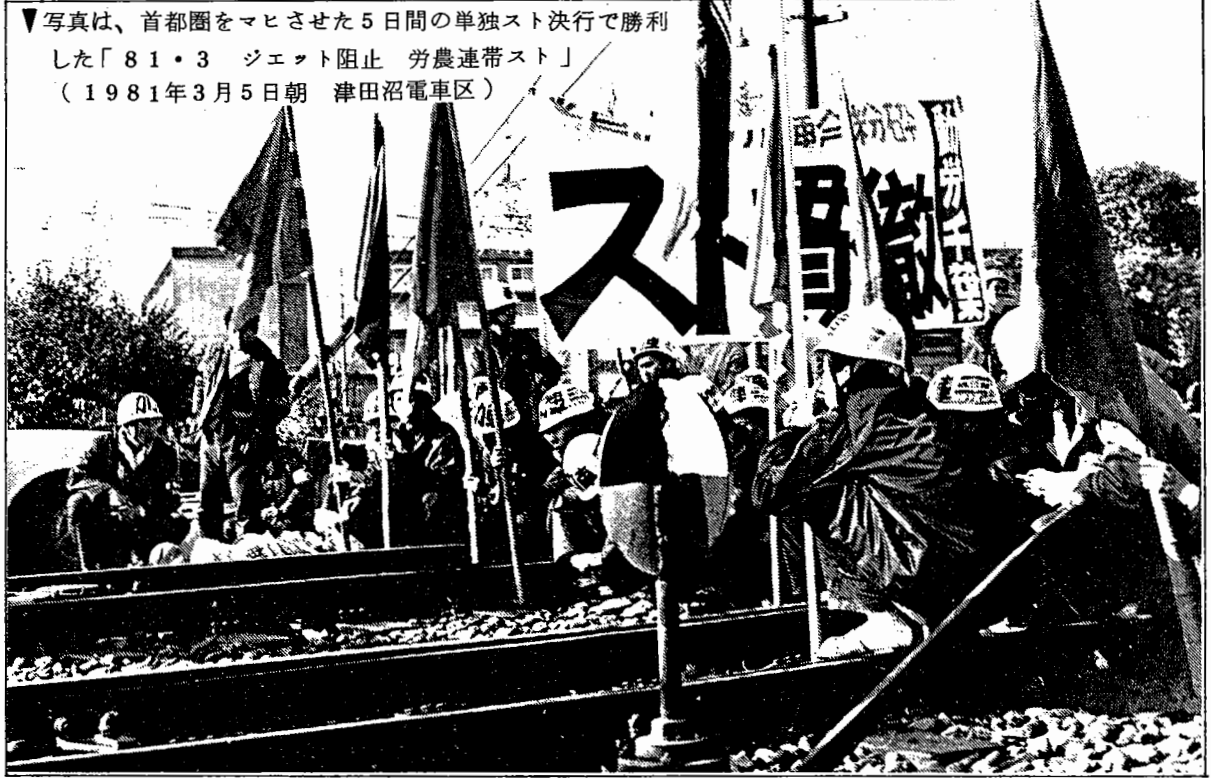
写真は、首都圏をマヒさせた5日間の単独スト決行で勝利した「81・3 ジェット阻止 労農連帯スト」(1981年3月5日朝 津田沼電車区)

今定期委員会で田中青年部長から新たに新藤青年部長を先頭とする新常任体制を確立した。われわれにかけられた課題は大きい。動労「本部」から分離・独立して6年目になるが、三〇万国鉄労働者の未来をかけて一大ストライキ実現にむけて最先頭で闘う決意である。(青年部常任委・寄稿)