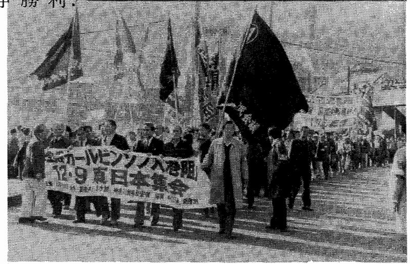
動労千葉95名は、鉄輪旗・横断幕を掲げて総評隊列1万8千のデモを戦闘的に牽引。