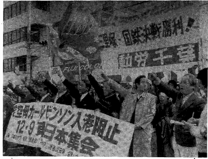
多くの市民の見守る中、基地正門前で怒りのシュプレヒコール。

こうした上で、世界最大の原子力核空母「カールビンソン」を世界最大の軍事演習「戦争挑発Ⅱ」「フリーテックス85」や「日米共同対潜特別訓練」をくりひろげた直後、横須賀に寄港させるということは、日本人民の反戦・反核意識の解体、日本全土の核基地化、独自の核武装化をもめざしたすさまじい攻撃のエスカレーションであり絶対に許すことはできない。