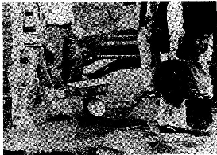
それぞれの釣果をもちより検量。

千葉市要町二一八(動力車会館) (鉄電)二九三五(六)公衆(〇四七)二二七二〇七