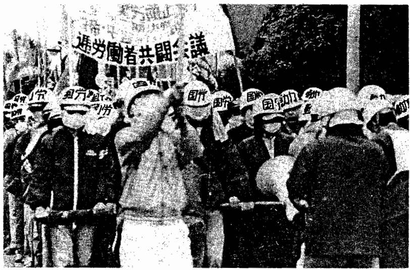
集会のたびに結集力を増やす国労共闘の仲間たちと固いスクラムで力強くデモ。(5・20三里塚)