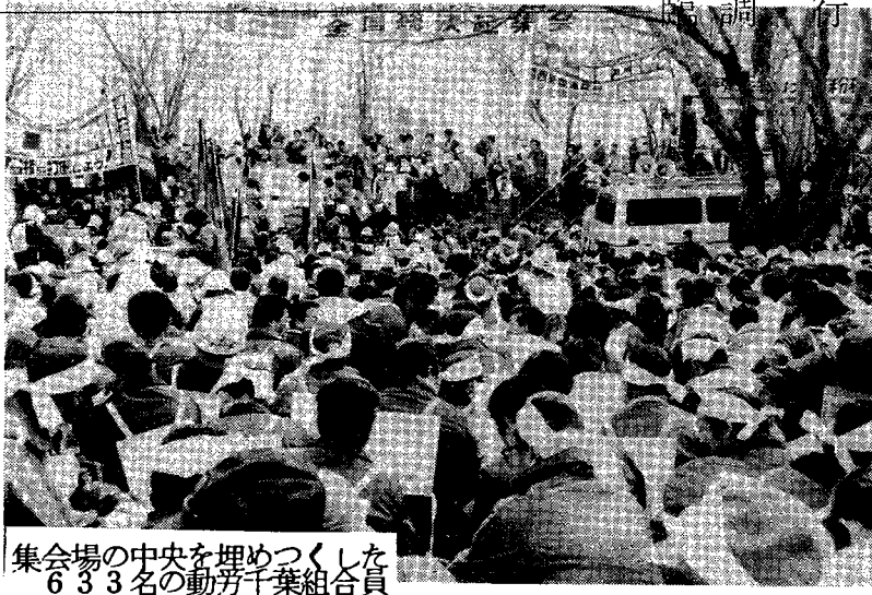
集会場の中央を埋めつくした 633名の動労千葉組合員

今秋二期着工粉碎をかかげて開かれたる・25全国総決起集会は、三里塚第一公園を埋めつくす一二、一五〇名が結集し大成功をかちとった。とりわけ、わが動労千葉は六三三名が決起し、見事に「五割動員」実現の快挙をなした。この力をもって動乗勤改悪阻止、八四春闘、反動中曾根内閣打倒の闘いに決起しよう。