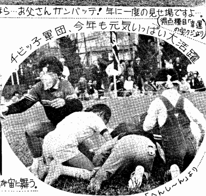
チビっ子軍団、今年も元気いっぱい大活躍 (「たんぽぽ」)