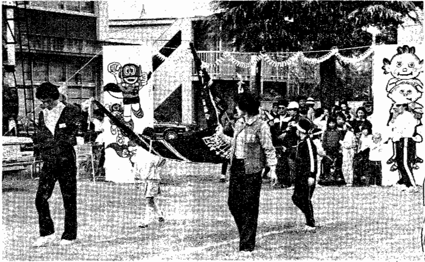
9時30分、全員で入場行進