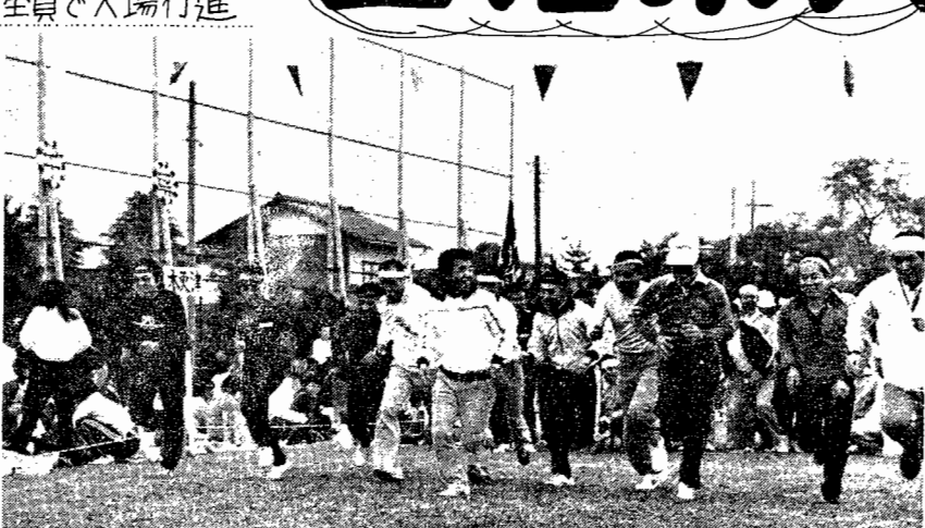
ほらほら...お父さんがんばって！年に一度の見せ場ですよ... (得点種目「幸運の宝クジ」)