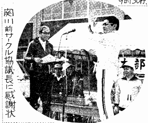
関川前サクル協議長に感謝状

各支部力と技と和を競い合つての各種競技、応援合戦など、青年・壮年・お母さん・チビっ子各々が一体にとけ合つて、熱戦が展開され、館山支部と新小岩支部が四〇対四〇の同点でトップ争いのまま最後の得点種目「支部対抗リレー決戦」にもつれこみ、結局このレースで抜群の実力でふり切つた館山支部に初優勝の栄冠が輝きました。「初優勝確定！」の瞬間、館山支部の観客席ではワッショイ、ワッショイと胴上げをはじめまるなど大変なさわぎ、その興奮もさめぬなか、表彰式、講評、恒例大人気の抽せん会などなどをもつて十五時三〇分、大成功のうちに終了しました。優勝〓館山、準優勝〓新小岩、第三位〓木更津支部が、各々本年度の栄冠を手にしました。