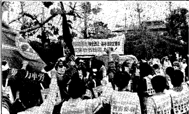
部落解放同盟千葉県連と女に決起