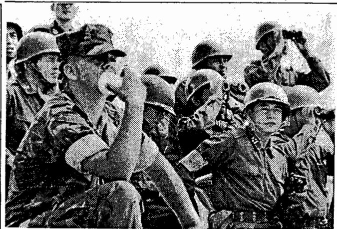
ブルービーチの特設観覧席で米兵に交じって演習を見学する自衛隊員 = 7日、沖縄本島中部で