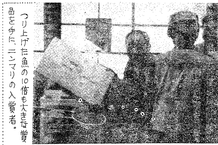
つり上げた魚の10倍も大きな賞品を手にした、ニンマリの入賞者。

11月3日 団結祭典・大運動会 近づく! 組員・家族とついで参加しよう。 ★団結祭典の準備は、今年も津田沼・幕張・千葉駅の各支部にお願ひしてあり、各種趣向をこらした企画が準備されています。詳細は10月15日の拡大運営会を決定