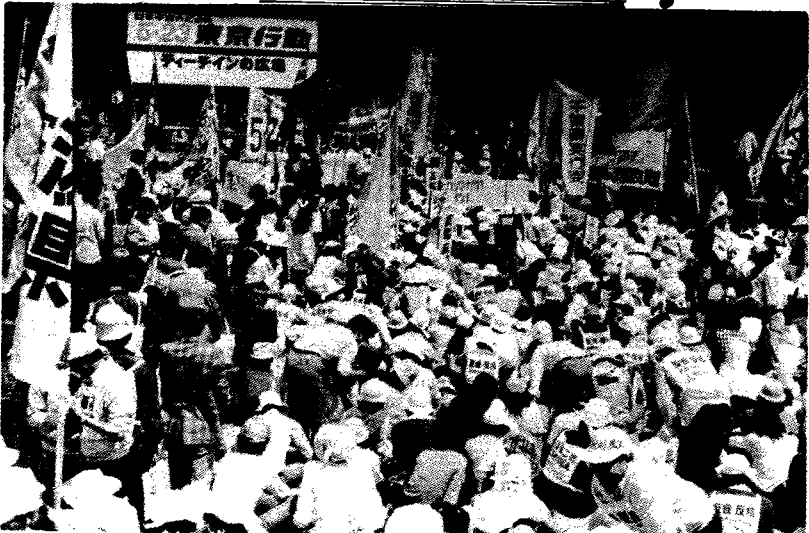
三里塚反対同盟、動労千葉はじめ三里塚を闘う勢力は、ティーチン広場の集会を埋め尽くし、「三里塚二期阻止、反戦、反核の闘いを終始牽引した。（5.23ティーチン広場）」