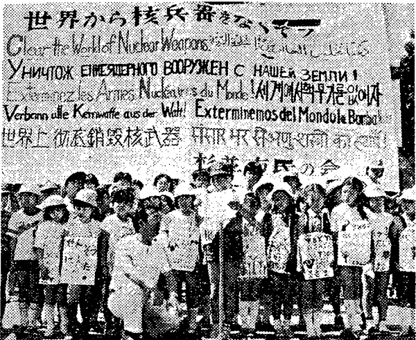
「核兵器をなくして」と訴える杉並区の小学生たち（ティーチン広場）