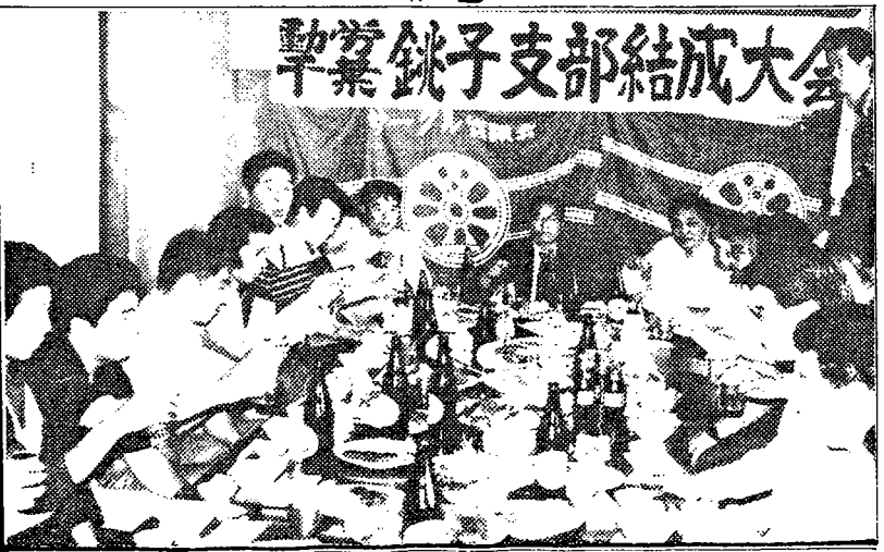
各支部代表もまじえ、結成報告・激励の祝賀 おもたれ、銚子の仲間の元気を決定が述べられた。 (大利根荘での報告集会)

今日まで、銚子の利益を守り、大同団結をめざして闘いぬいてきたこと、今後再統一をめざして努力するという方針を満場一致の力強い拍手の中で確認していった。続いて、新役員を選出し、組合歌、団結ガンバローを三唱し、大利根荘での報告集会へと移っていった。