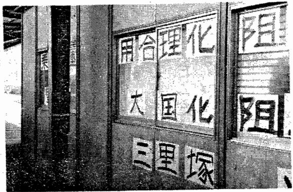
「本部」反動分子の裏切(東京三局10/1実施)をテコに、国鉄当局は、「政治生命をかけて」千葉11/1強行実施の攻塵をかけてきた。10月総決起はこれを粉砕した。

という形で執行部の人もがんばってやり切りました。取場では業務員運用合理化の関心はやっぱり高いです。内考線の反合・運転保安闘争を日常的に全員でずーと続けてきているでしょう。そのせいもあって、それなりに考の方が定着しているように思う。東京が九月段階で、あんな妥協をしましてしまったとは全く驚くというが、腹が立つ。それと銚子の仲間が早くのれぬれと一緒に進めばネ……、それだけです、取場で皆心配しているよ。」