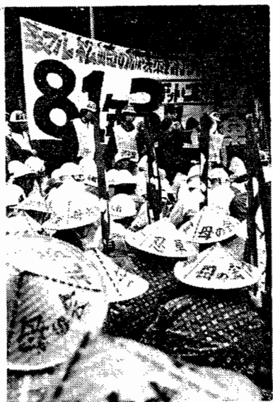
10/21反戦デー(白谷野音)勤労千葉独自集会

「この六月に支部青年部を造成してからの運動はたのしくてしようがない。こういう動員なんかだと自分で進んで出てくる青年部員も多い。年輩の人もよく面倒みてくれるし、だんだん支部全体が落ちついてまとまってきたのを感じる。僕は10・10集会は私用で行けなかったけど、それ以外は10・19、21、27、31全部出ました。面白かったですね」