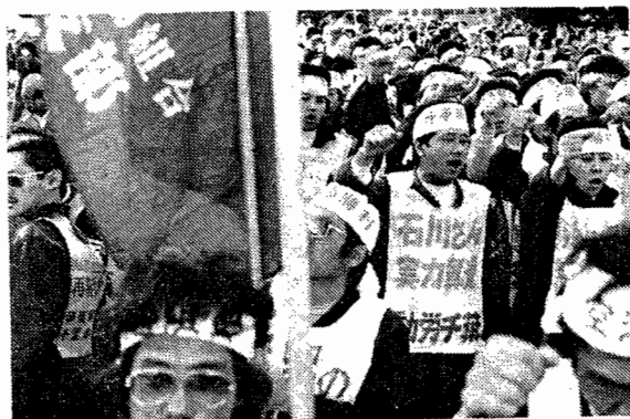
10月総決起行動で青年部はすさまじい力を発揮した。万余の歓声に迎えられて10.31狭山闘争(明治公園)会場に入場。

「僕も十月は全部出ました。最近では『本部』の連中があんなまじり取場に来なくなっちゃって、楽しみが減っていた所だから、東京へ行くぞっ、たら皆はり切っちゃってね。『本部』のやつら？あんなの今じゃ取場にきても年輩も若手もゴリゴリやつらを論破しちゃうから、泣きべそで帰っちゃうね。でも時々三