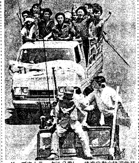
ジープやトラックに分乗し、棒や自動小銃で武装して行進する光州市の労働者学生 (5月21日)