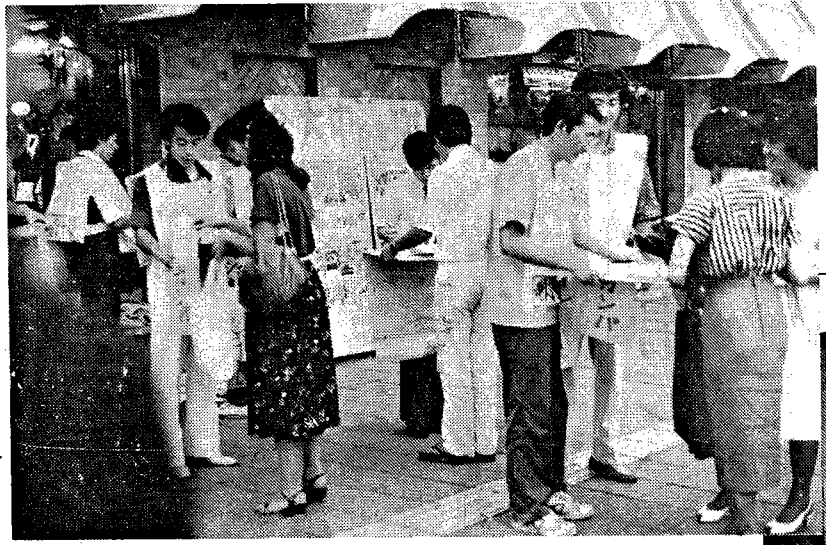
多くの人が、光州蜂起支持・金大中氏ら救出を助け、署名に協力してくれた。(8月28日、千葉駅)

また、この街頭行動に先だち、学園協の仲間が放課後視聴覚教室において、韓民統作製のドキュメントフィルム「韓国一九八〇年―血の抗争の記録」(16mm 30分)上映・討論会を約五〇名の参加で勝ちとり、あらた