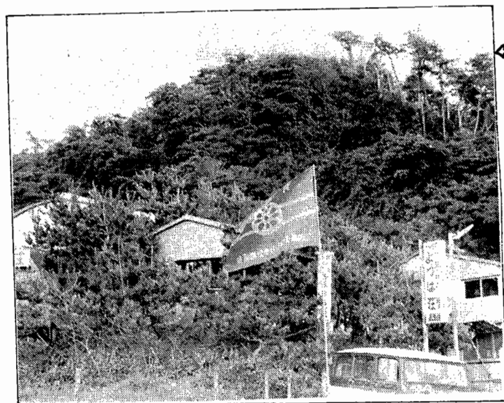
サマーキャンプのベース「よつば荘」にひるがえる青年部旗