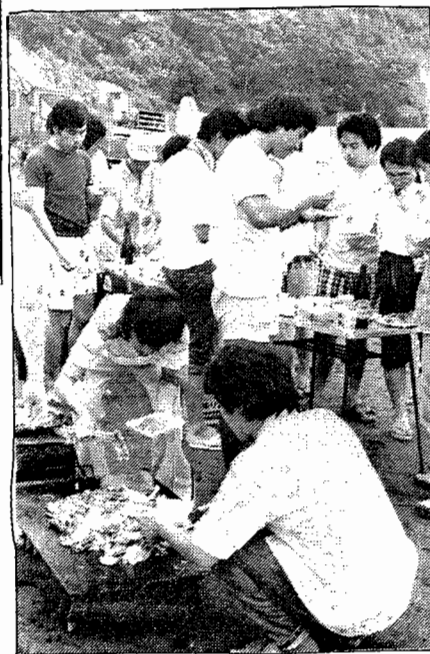
海辺での鉄板焼の味は格別!