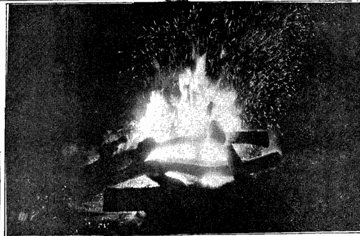
キャンプファイアーの炎を囲んで、酒が進むと共に歌が出、踊り(?)が出、夜が更けて……