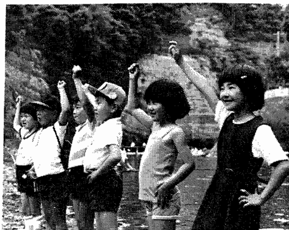
お父ちゃん達にならって、団結ガンパロー!!(4ピッキ一年生軍団)

少々のアルコール?!色とりどりの弁当が所せましと並べられ、途中で収獲した竹の子を入れての、「とん汁」の本格的なキャンプ料理で全員にふるまう支部。持参の釣竿でハヤ、ヤマベを狙う者あり、はては、不当処分粉砕へむけた青空討論会を行うグループあり、子供達は清流にひさまでつかり水遊びに興じ、それぞれ思い思いに約二時間を楽しみ、最後に動労千葉の次代をになう「ピッカピッカ」の一年生諸君による「団結ガンパロー」が行われ、帰途につきました。 帰路は、子供達の元気な足どりに牽引されながら、14時30分解散地の養老溪谷駅前に到着し、参加者全員の抽せん会を楽しみ、盛況のうちに記念ハイキングを終了しました。