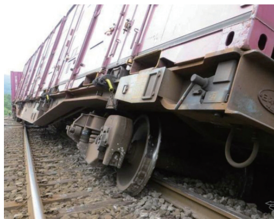
写真：2013年9月19日 JR函館線貨物列車脱線事故