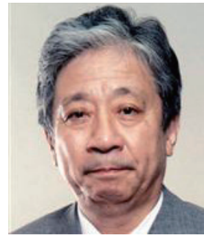
・左上：葛西敬之 (現、JR東海会長)