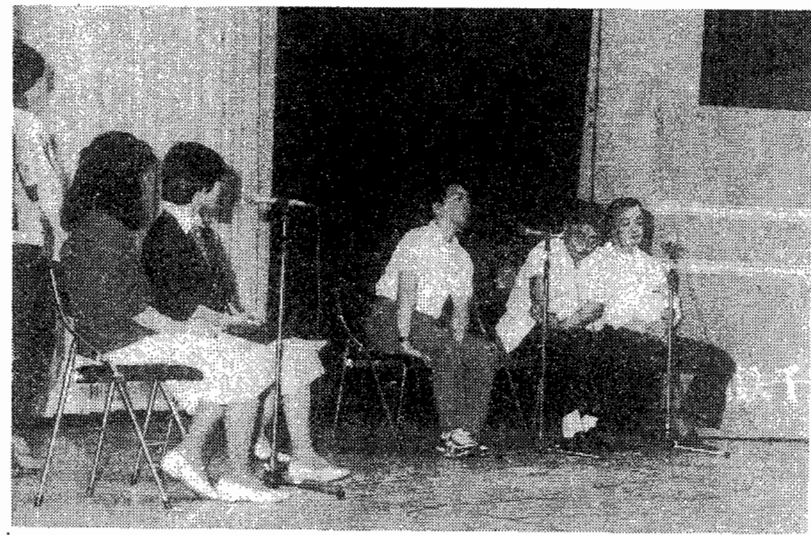
動労千葉、家族会、それに本山家族会も加わってのパネル討論には、会場の全員が、同じ喜び、苦悩、誇り、決意を共有して、大いに盛り上った。

新小岩・横浜・中野・立川・お茶の水と各上映会は圧倒的に大成功した。この成功にふまえ、いよいよ全国各地の上映会が開催される。 W選挙あけの国鉄国会「61・11ダイ改」一八万人合理化と真向から対決し、第三波を闘い得る陣形をつくりあげるためにも全国上映運動・物販運動を大成功させよう。全組合員がさらに総決起しよう。