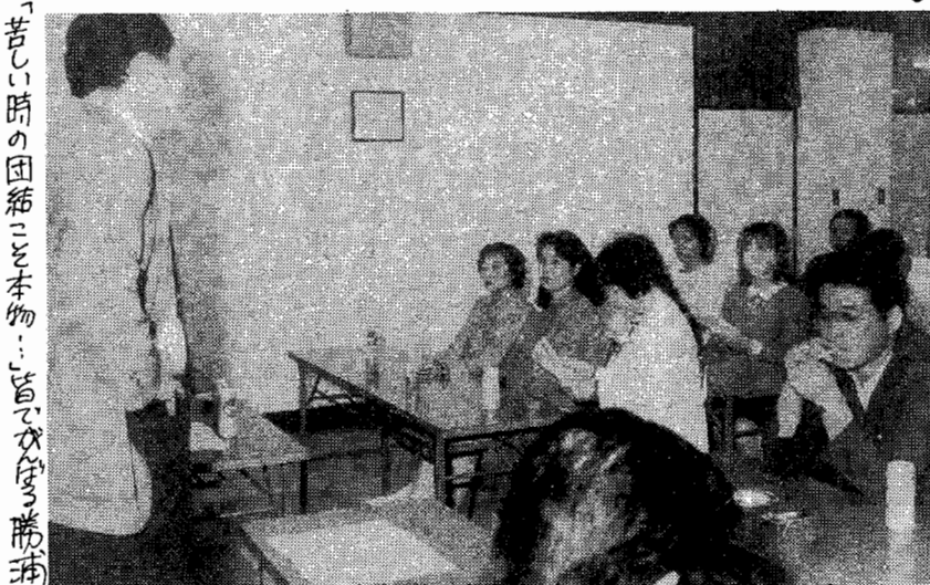
「苦しい時の団結こそ本物」...と語りあう勝浦