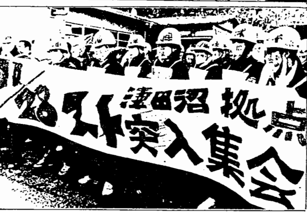
▲勝利への一大血路を切り拓いた11月第一波スト